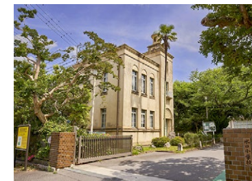
甲賀市立 水口小学校