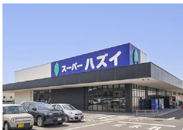
スーパーハズイ 水口店