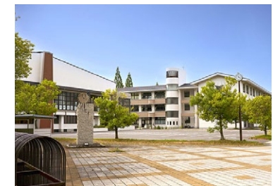
甲賀市立 城山中学校