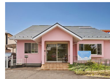
たなか小児科医院