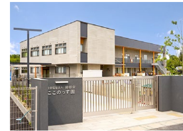
幼保連携型認定こども園 このっす園