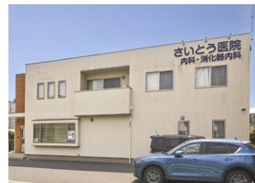
さいとう医院内科・消化器内科