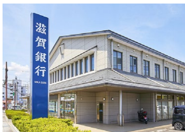
滋賀銀行 水口支店