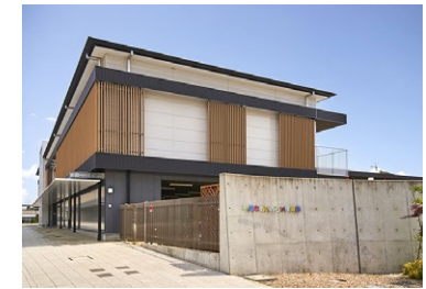
あいみらい保育園