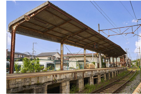
近江鉄道「水口石橋」駅