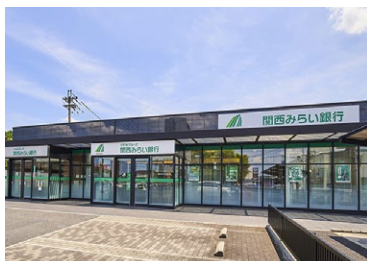
関西みらい銀行 水口支店