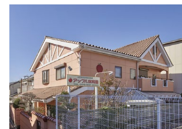
アップル保育園 徒歩 11 分