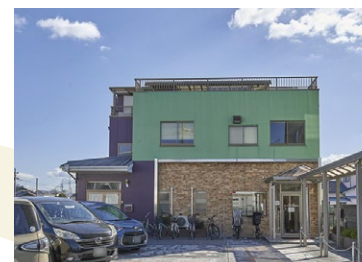
すこやか小児科さだ 徒歩8分