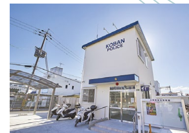
枚方警察署 蹠跏交番 徒歩 8 分

徒歩 6 分の光善寺保育園のほか、アップル保育園、さだ保育園など保育施設が近隣に充実。 蹠跏西小学校へ徒歩 6 分、蹠跏中学校が徒歩 4 分。お子様、ママパパ winwin の教育環境です。 商業施設は「光善寺」駅前にひらら光善寺がオープン。スーパーナカガワやマツモトキヨシなどがテナントです。近隣主要幹線のロードサイドには大型商業施設も点在。大寿会病院や吉田病院など総合病院も身近で安心です。 また枚方市立さだ図書館など子供が学べるスポットも。 ひらかたパークや淀川河川公園など週末に家族で遊べるアミューズメントにも恵まれています。