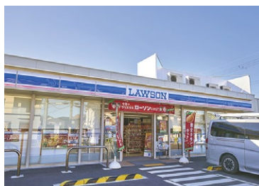
ローソン 枚方出口五丁目店 徒歩13分