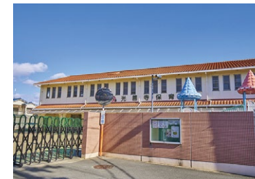
光善寺保育園 徒歩 6 分