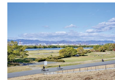
淀川河川公園出口地区 徒歩10～11分