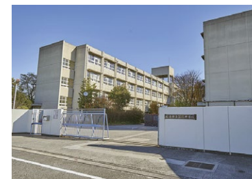
蹠跏中学校 徒歩 4 分