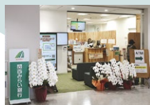
関西みらい銀行 光善寺駅前出張所 徒歩7～8分