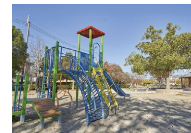
出口ふれあい公園 徒歩10～11分