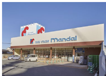
万代香里西店 徒歩22分