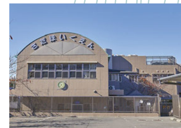
さだ保育園 徒歩 14 分