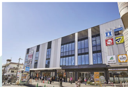
ひらら光善寺 徒歩7分