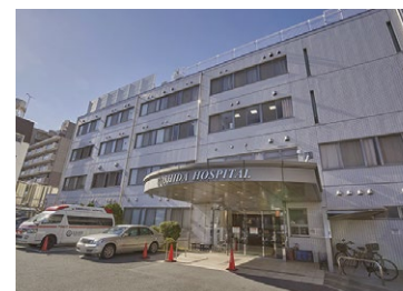
医療法人毅峰会 吉田病院 徒歩13分