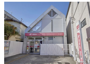
枚方中振郵便局 徒歩 9 分