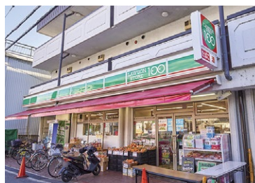
ローンストア100 枚方北中振店 徒歩5～6分