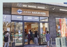
スーパーストアナカガワ 徒歩9分