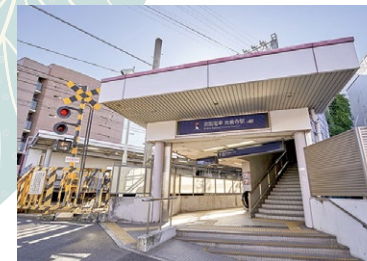
京阪本線「光善寺」駅 徒歩 10 分