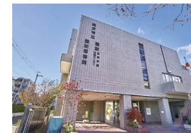
枚方市立さだ図書館 徒歩10分