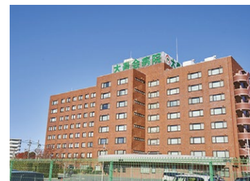
大寿会病院 徒歩12～13分