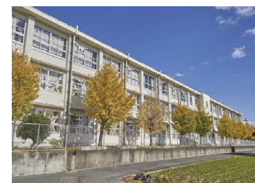
蹠跏西小学校 徒歩 6 分