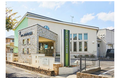
よりずみ医院 徒歩 3 ～ 5 分