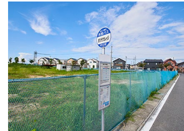
市民バス「ポリテクカリッ」 徒歩1～3分