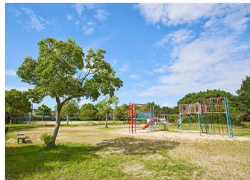
篠原公園 徒歩 4 ～ 6 分