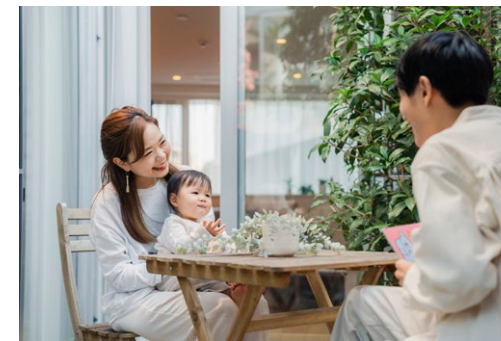
ウチ・ソト一体の開放的な暮らしを