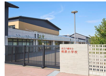
桐原小学校 徒歩17～19分