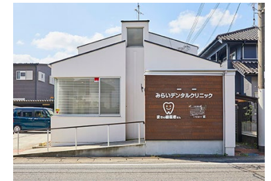
みらいデンタルクリニック 徒歩 14 ～ 16 分