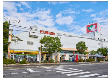
平和堂篠原店 徒歩 6 ～ 8 分