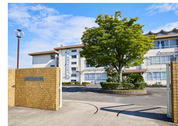
近江八幡市立八幡西中学校 徒歩13～16分