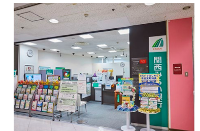
関西みらい銀行 平和堂篠原プラザ 徒歩6～8分