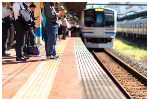
JR「篠原」駅徒歩 9~11 分の利便性