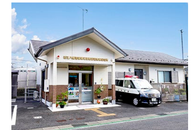
篠原駅前駐在所 徒歩9～11分