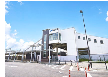
JR 琵琶湖線「篠原」駅 徒歩9～11分

現地からJR「篠原」駅間には平和堂や公園、郵便局、医院などが点在。240以上の店舗が結集する三井アウトレットパーク滋賀竜王や、情緒的な街並みと洒落たカフェなどが軒を連ねる八幡堀もお車なら約13~15分とお手軽コース。東近江医療圏唯一の救命センターで地域周産期母子医療センターの市立総合医療センターへはお車で約5分と安心感があります。また近江八幡市は子育て情報アプリを公開するなど支援体制も充実しており子育て世代に人気の自治体。現地近くを流れる日野川は自然豊かでお子様の感性を豊かに育みます。