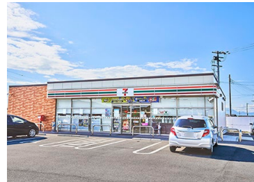
セブンイレブン近江八幡池田本町店 徒歩 25 ～ 27 分