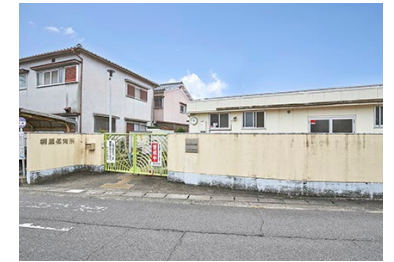
桐原保育所 徒歩32～34分