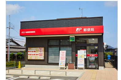
近江八幡桐原郵便局 徒歩8～10分