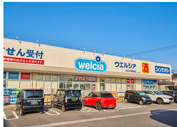
ウェルシア近江八幡若宮店 徒歩 35 ～ 37 分