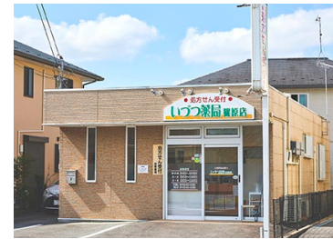
いづつ薬局篠原店 徒歩 3 ～ 5 分