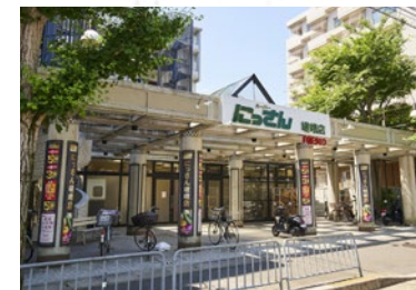
フレスコにっさん嵯峨店 徒歩 5 分 (400 m)