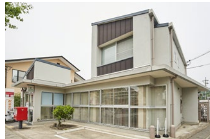
京都広沢郵便局 徒歩6分(450m)