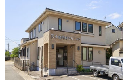
小島内科クリニック 徒歩5分(400m)