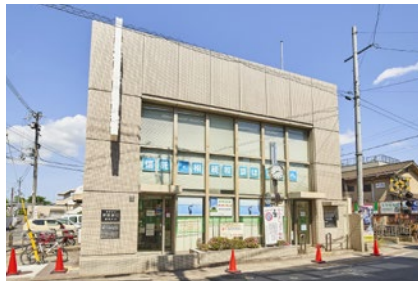
京都銀行 嵯峨支店 徒歩18分(1400m)