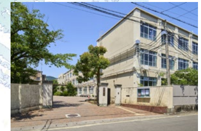
嵯峨中学校 徒歩 9 分 (670 m)