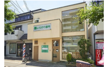
よねざわ歯科 徒歩5分(350m)