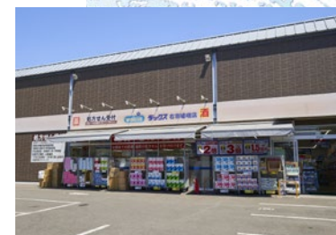
ドラッグストアダックス 徒歩 5 分 (350 m)