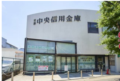
京都中央信用金庫 常盤支店 徒歩10分(800m)