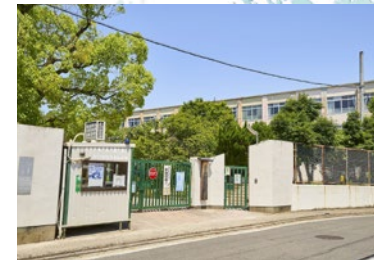
広沢小学校 徒歩 4 分 (260 m)