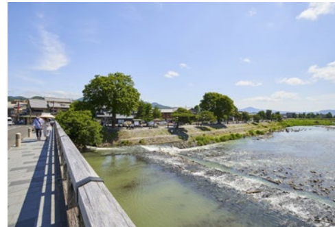
嵐山 渡月橋 徒歩25分(2000m)