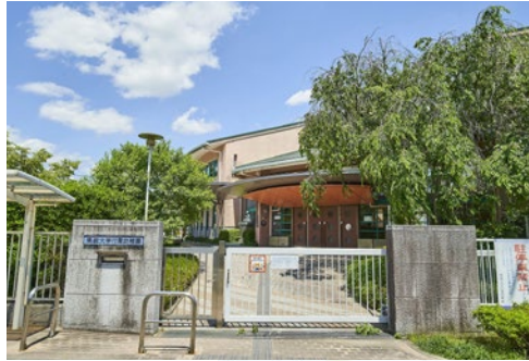
私立 佛教大学付属幼稚園 徒歩8分(600m)