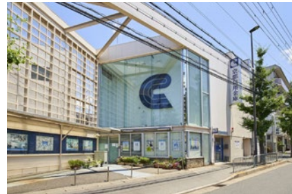
京都信用金庫 常盤支店 徒歩12分(950m)