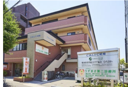
太秦病院付属うずまさ第二診療所 徒歩5分(350m)