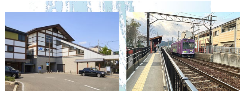
JR 嵯峨野線嵯峨嵐山駅 徒歩 15 分 (1,130 m) 嵐電本線「車折神社駅」 徒歩 11 分 (880 m)

教育施設は広沢小学校が徒歩4分、嵯峨中学校が徒歩9分と安心の近隣感覚。丸太町通りにケヨーデイツー、万代、フレスコ、ダックスなどの商業施設が点在しています。医療施設は大小様々なクリニック、総合病院が徒歩圏に多数揃っているので安心です。広沢池や北嵯峨の田園風景、嵐山など自然の景観美、大覚寺や天龍寺などの古刹・名刹、さらに情緒豊かな街並みなど、世界から眼差しを向けられる周辺環境もかけがえのない魅力です。