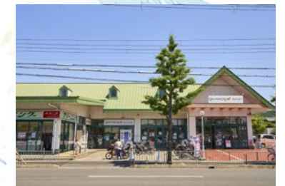
ダイエーグルメシティ 徒歩 10 分 (800 m)