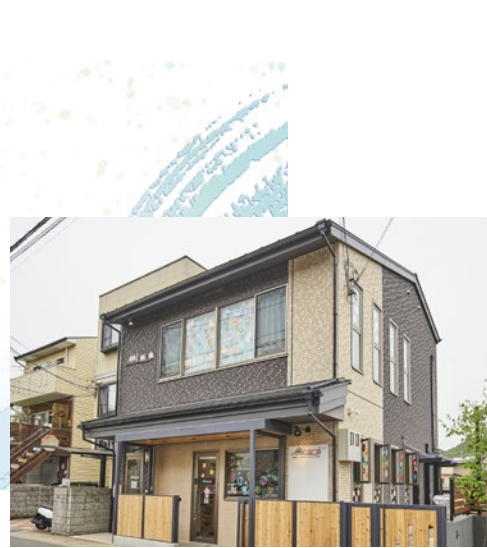
私立 保育ルーム ohana 徒歩4分(300m)