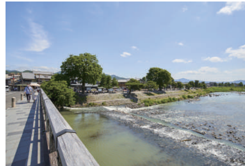
嵐山 渡月橋 徒歩24分(1900m)