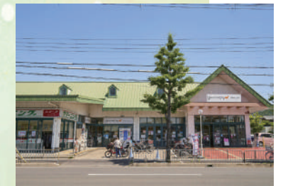
ダイエーグルメシティ 徒歩 10分 (750 m)