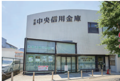
京都中央信用金庫 常盤支店 徒歩13分(1000m)