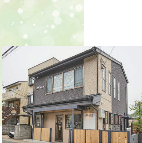
私立 保育ルーム ohana 徒歩6分(450m)