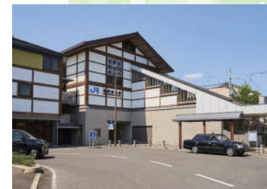
JR 嵯峨野線嵯峨嵐山駅 徒歩 13分 (1000 m) 嵐電本線「鹿王院駅」 徒歩 10分 (800 m)

現地から徒歩6分の広沢池は四季折々の自然美を見せてくれる憩いのスポット。畔には遊具付きの公園もあってご家族での散策も楽しみです。天龍寺や大覚寺、嵐山などのメジャースポットに手軽にアクセスできるのもこの街ならではの贅沢。Ohana こども園、佛教大学附属幼稚園、広沢小学校、嵯峨中学校、すべて徒歩7分圏内に揃うので通園・通学も安心です。日常のお買物は徒歩2分の丸太町通りに多彩なショッピング施設が充実。大小さまざまな医療機関も徒歩圏内に数多く揃っているので安心して暮らしていただけます。