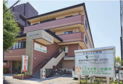
太秦病院付属うずまさ第二診療所 徒歩7分(510m) 小島内科クリニック 徒歩5分(350m)