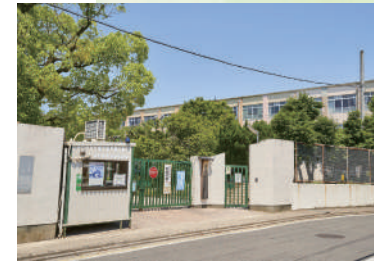
広沢小学校 徒歩 2分 (130 m)