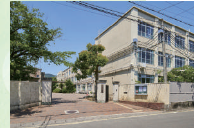
嵯峨中学校 徒歩 5分 (400 m)