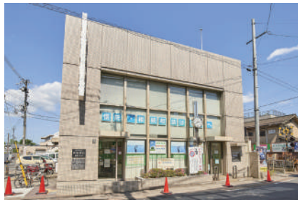
京都銀行 嵯峨支店 徒歩17分(1300m)