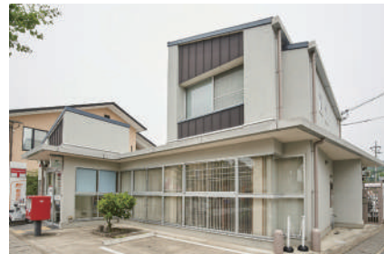
京都広沢郵便局 徒歩9分(650m)