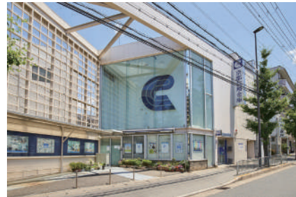
京都信用金庫 常盤支店 徒歩14分(1100m)