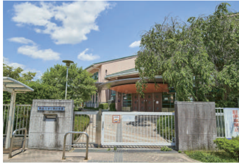
私立 佛教大学付属幼稚園 徒歩6分(450m)