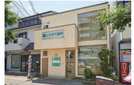
よねざわ歯科 徒歩4分(280m)