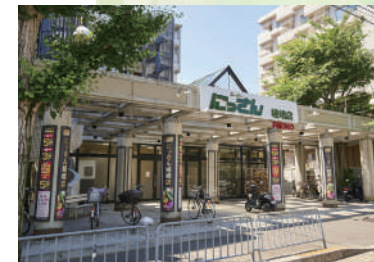
フレスコにっさん嵯峨店 徒歩 5分 (350 m)