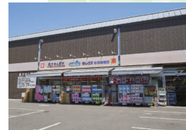
ドラッグストアダックス 徒歩 4分 (300 m)