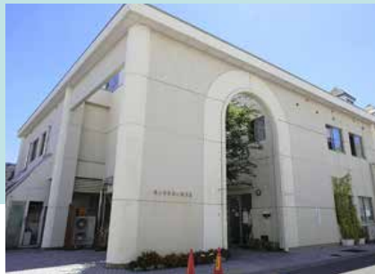
守山保育園 徒歩13分(約1000m)