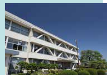
市立守山小学校 徒歩12分(約950m)