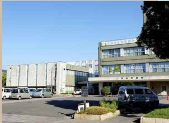
守山市役所 駅前出張所 徒歩10分(約790m)