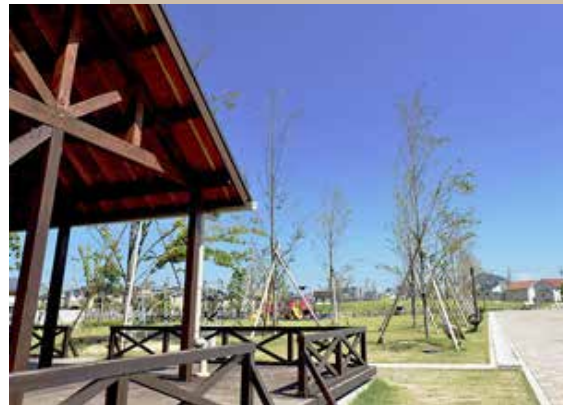
えんまどう公園 徒歩13分(約980m)