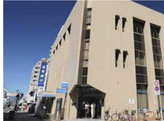
滋賀銀行 守山支店 徒歩10分(約800m)