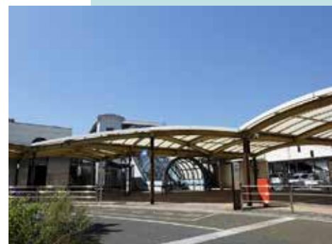
JR 東海道線「守山」駅 徒歩6分(約480m)

かつての宿場町らしい街並み、守山天満宮・勝部神社など歴史や文化を感じる周辺環境がお子様の感性を豊かに育むことでしょう。少し足を伸ばせば守山市民運動公園といったホテルの鑑賞スポットが周辺に複数あるなど、すべての世代に優しい環境です。