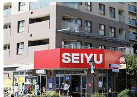
西友守山店 徒歩8分(約590m)