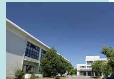
市立守山南中学校 徒歩20分(約1600m)