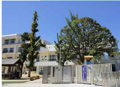
市立守山幼稚園 徒歩12分(約950m)