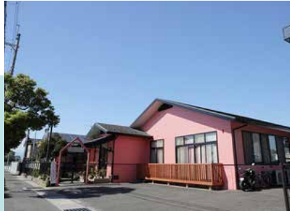
私立カナリヤ保育園分園 徒歩9分(約700m)