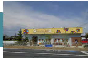
いどうりファミリー歯科 徒歩 4～5分