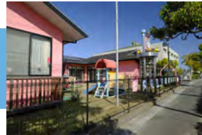
カナリヤ第二保育園 徒歩 4～5分