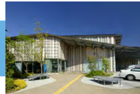
守山市立図書館 徒歩 11～12分