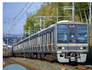
JR「守山」駅から新快速で主要都市へ直結