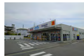
ウエルシア滋賀守山店 徒歩 11～12分