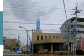
滋賀中央信用金庫 守山支店 徒歩 12～13分