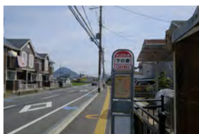
下之郷バス停 近江鉄道バス 徒歩 1～2分