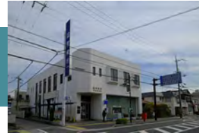
滋賀銀行 守山北支店 徒歩 13～14分