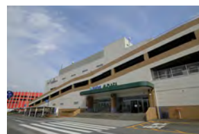
モリーブ、アル・プラザ守山 徒歩 11～12分