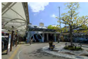
JR 琵琶湖線「守山」駅 徒歩 30～31分