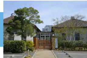
私立若鮎保育園 徒歩 5～6分