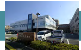
済生会守山市民病院 徒歩 13～14分