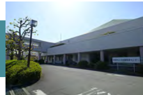
滋賀県立小児保健医療センター 徒歩 7～8分