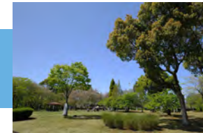
守山市民運動公園 徒歩 7～8分