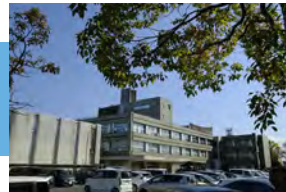
守山市役所 徒歩 17～18分