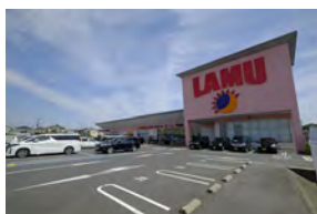
ラ・ムー守山店 徒歩 8～9分