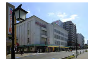
平和堂 守山店 徒歩 28～29分