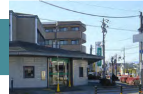
関西みらい銀行 守山支店 徒歩 15～16分