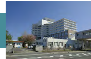
滋賀県立総合病院 徒歩 9～10分