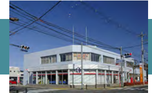
近江守山郵便局 徒歩 11～12分