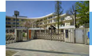
守山幼稚園 徒歩 26～27分