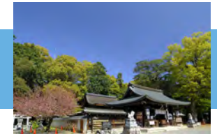
勝部神社 徒歩 30～31分