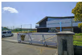
市立守山中学校 徒歩 3～4分