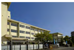
市立吉身小学校 徒歩 21～22分