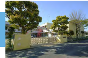
市立吉身幼稚園 徒歩 21～22分