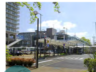
近隣、そして駅前にも生活利便施設が充実