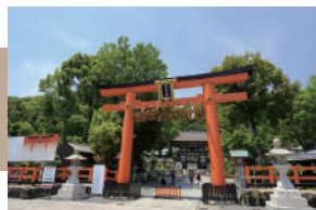
松尾大社 徒歩 7 ~ 9 分