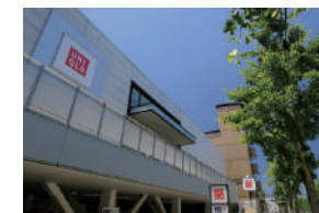
ユニクロ 徒歩 18～20分