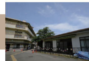
富士保育園 徒歩 18 ~ 20 分