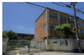
松尾小学校 徒歩 6～8分