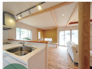
全区画 32 坪以上、恵まれた環境を活かした提案設計。