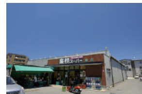
業務スーパー 徒歩 19～21分