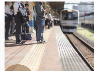
「桂」駅経由で、京都・大阪中心街へ快適アクセス。