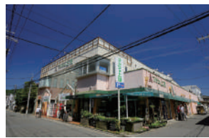
マルシェ上桂 徒歩 12～14分