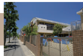
京都にじこども園 徒歩 17 ~ 19 分