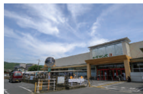
フレンドマーケット 徒歩 22～24分