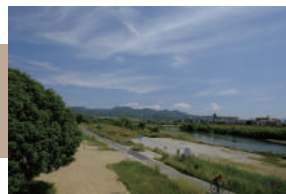
松尾公園 徒歩 8 ~ 10 分