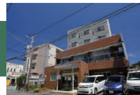
北村内科診療所 徒歩 12 ~ 14 分