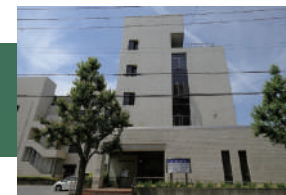
内田病院 徒歩 11 ~ 13 分