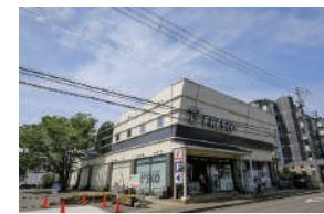
フレスコ 徒歩 13～15分