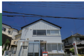
松尾郵便局 徒歩 4 ~ 6 分