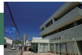
京都中央信用金庫上桂支店 徒歩 11 ~ 13 分