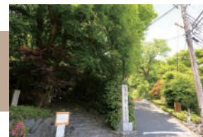
鈴虫寺 徒歩 7 ~ 9 分