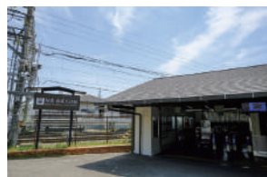
阪急松尾大社駅 徒歩 7～9分