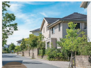
名所古刹を間近に控えた第一種低層住宅専用地域。