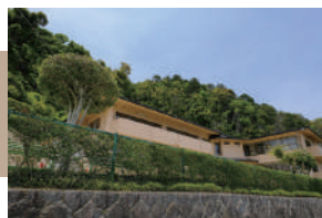
松尾幼稚園 徒歩 5 ~ 7 分