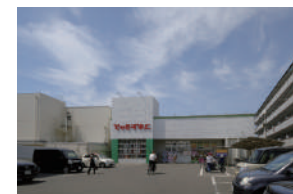
スギドラッグ 徒歩 21～23分