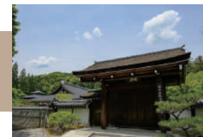
西芳寺 徒歩 12 ~ 14 分