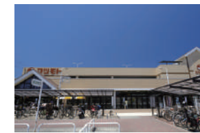
マツモト 徒歩 20～22分