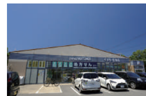
ドラッグユタカ 徒歩 14～16分