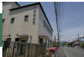
京都銀行松尾支店 徒歩 6 ~ 8 分