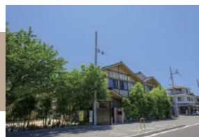
こぐま上野保育園 徒歩 13 ~ 15 分