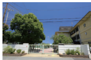
松尾中学校 徒歩 3～5分