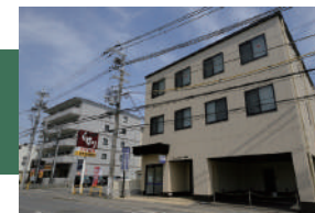
京都信用金庫西梅津出張所 徒歩 20 ~ 22 分