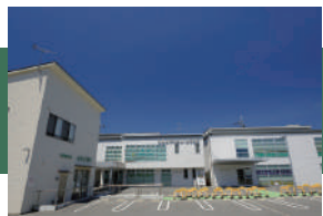
松尾メディカルスクエア 徒歩 11 ~ 13 分