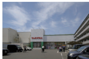
スギドラッグ 徒歩 21～23分