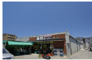
業務スーパー 徒歩 19～21分