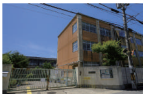
松尾小学校 徒歩 6～8分