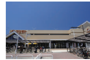
マツモト 徒歩 20～22分