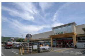
フレンドマート 徒歩 22～24分