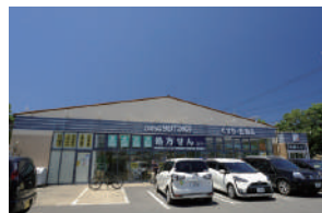
ドラッグユタカ 徒歩 14～16分