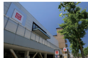
ユニクロ 徒歩 18～20分