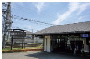
阪急松尾大社駅 徒歩 7～9分