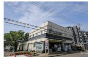
フレスコ 徒歩 13～15分