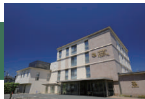
身原病院 徒歩 14 ~ 16 分