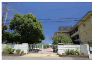
松尾中学校 徒歩 3～5分