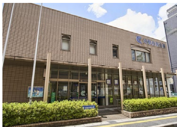
京都信用金庫南草津店