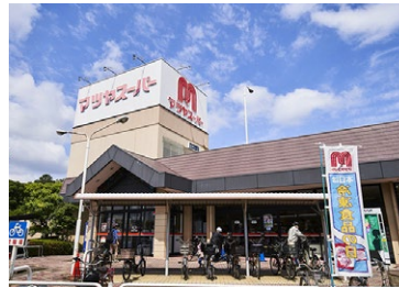
マツヤスーパー 矢倉店