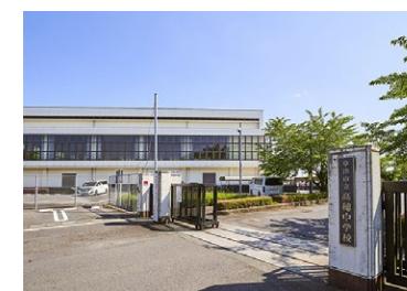
草津市立高穂中学校