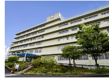
近江草津徳洲会病院