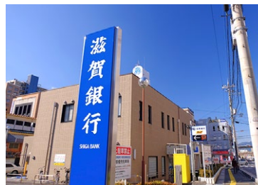
滋賀銀行南草津駅前支店