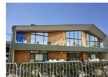
レイモンド東矢倉保育園