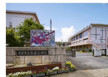
草津市立矢倉小学校