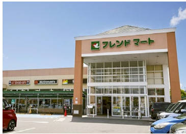
フレンドマート 追分店