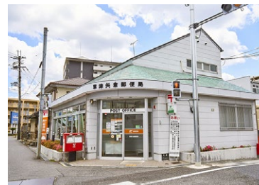
草津東矢倉郵便局